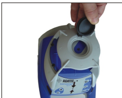
Pri použití v interiéri odklopte veko: pod ním svieti laserová olovnica