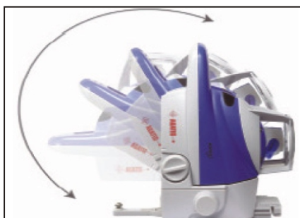
Jednoduché nastavenie sklonu - držiak umožňuje aretáciu v ľubovoľnom sklone