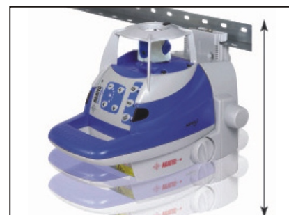
Prístroj zavesený na konzole. Nastavenie presnej výšky na univerzálnom držiaku