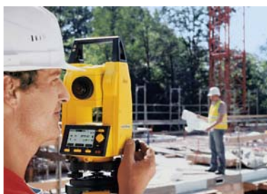
Jednoduchá obsluha s večnými pohybovkami