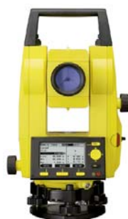
Bezhranolová totálna stanica Builder TR a Builder TRM s laserovým diaľkometerom