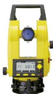
Stavebný teodolit Builder T